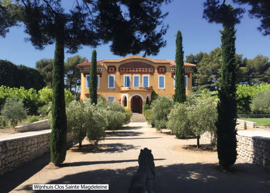
Wijnhuis Clos Sainte Magdeleine