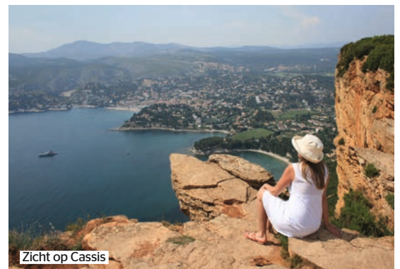
Zicht op Cassis

De Cours Mirabeau, met huizen als paleizen, deelt het oude centrum in tweeën. Voor vertier moet je naar de ene kant, voor cultuur naar de andere, want vrijwel alle musea liggen in de chique wijk Mazarin. Begin bij Musée Granet, de oude kunstacademie waar Cézanne zijn eerste lessen kreeg. De collectie is een lange en heel ▶