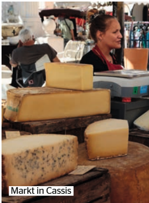
Markt in Cassis

complete reis door de geschiedenis van de schilderkunst, waarin werk van Rembrandt, Monet, Van Gogh en natuurlijk Cézanne niet ontbreken. In dezelfde straat ligt het Gallifet Art Center, en al houd je niet van moderne kunst: het designterras alleen is al de moeite waard. Het Caumont Centre d'Art vonden wij wat teleurstellend. Gewoon overslaan, tenzij je absoluut de tijdelijke expositie wilt zien. Dan liever naar het Pavillon Vendôme: een juweeltje, en veel minder pretentius.