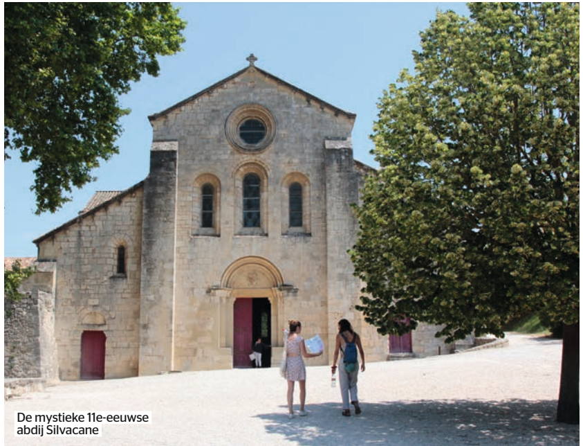
De mystieke 11e-eeuwse abdij Silvacane