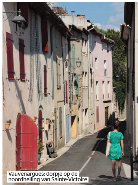
Vauvenargues; dorpje op de noordhelling van Sainte-Victoire

niet al te veel culturele hoogtepunten, hoewel Silvacane de moeite van een omweg waard is. De 11e-eeuwse abdij is veel minder bekend dan die van Sénanque, waarschijnlijk vanwege het ontbreken van een lavendelveld voor de kloostermuren. Silvacane moet het doen met een droog grasveldje en een vijver met wat goudvissen en waterlelies. Maar de sfeer is er zoals je van een cisterciënzerabdij verwacht: sober en mystiek, en alles van een eenvoudige schoonheid. Een schilderklas legt de sfeer vast op doek in de schaduw van een eeuwenoude kastanje, ieder op zijn manier. Na Silvacane hebben we wat rondgereden; niet gestuurd door de navigatie, wel door de kaart Route des Vins de Provence, want het wemelt hier van de wijnhuizen. Sommige hebben de ►