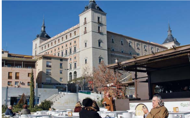
BOVEN Het Alcázar domineert de skyline